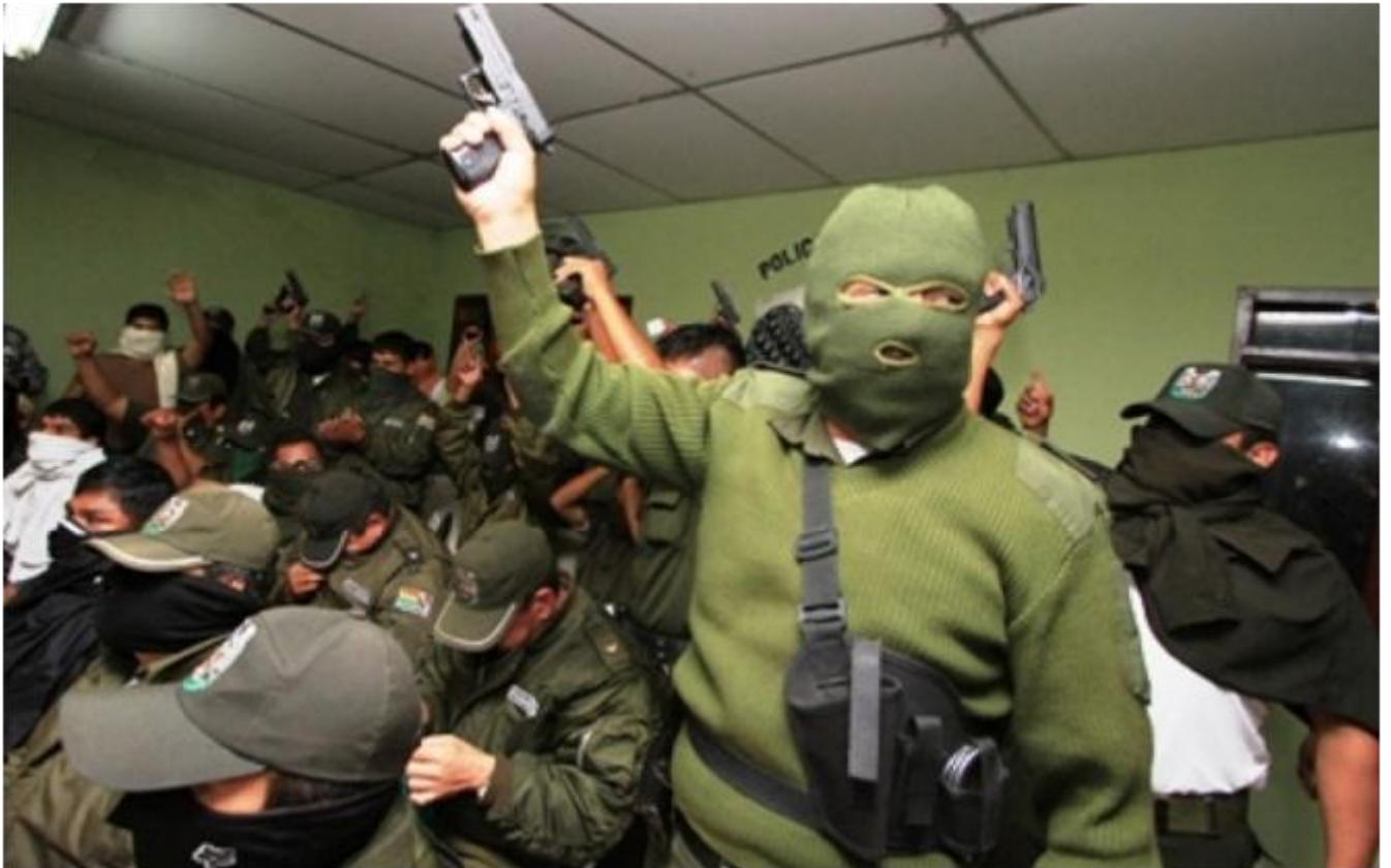
ANF Agencia de Noticias Fides ( www.noticiasfides.com )